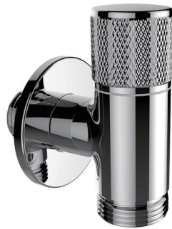
Project Line 洗衣机龙头